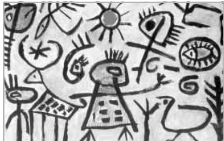
مجموعة من أعمال صدر الدين حمه

أول صفة لأعمال حمه هي بناءاتها اللونية المتنوعة في درجاتها، اللون عنده يأتي قويا من الفضاءات المحيطة بالأشكال ليخلق درجة عالية من التضاد في معظم لوحاته لكي يمنح الشكل صفة الموضوع القصوى لكي يقدم تعبيره ويعاون اللون أحيانا توسع في خطوط اظهار الشكل الخارجية ليؤكد مرة أخرى على أن الشكل الرمز هو وحدته البنائية الأساسية